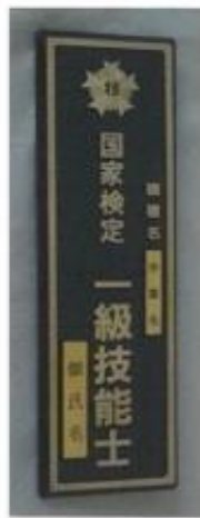
⑦1級門標 (34.6cm×10.5cm×1cm 文字凸2mm) ¥15,950