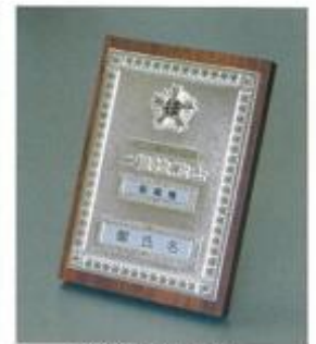
⑩2級机上用 24cm×16.5cm×2cm ¥19,800