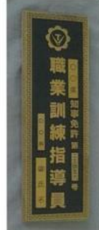
⑮指導員門標 (37cm×12cm×1cm) ¥19,800