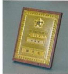
⑥1級机上用 (ダ イカスト製1級金メッキ・2級銀メッキ) ¥20,900