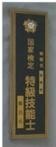
③ 特級門標 ¥18,150