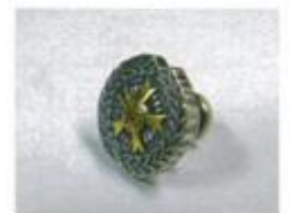
⑯全技連パッチ (直径1.4cm) ¥2,200