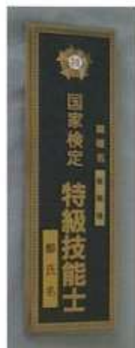
③ 特級門標 ¥18,150