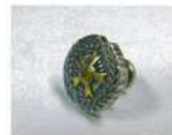
⑯全技連パッチ (直径1.4cm) ¥2,200