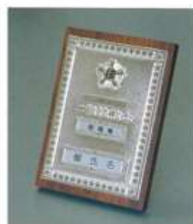
⑩2級机上用 24cm×16.5cm×2cm ¥19,800