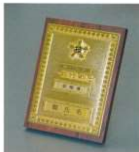
⑥1級机上用 (ダ イカト製1級金メッキ・2級銀メッキ) ¥20,900